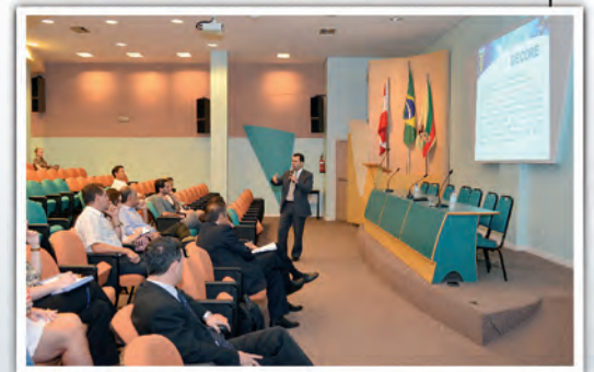
Público atento às mudanças que garantem segurança

Para saber mais e conferir todos os documentos que fundamentam a emissão da DECORE: www.crcsc.org.br