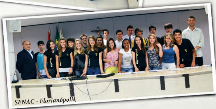
SENAC - Florianópolis