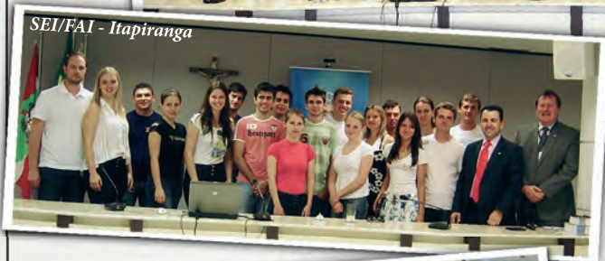
SEI/FAI - Itapiranga