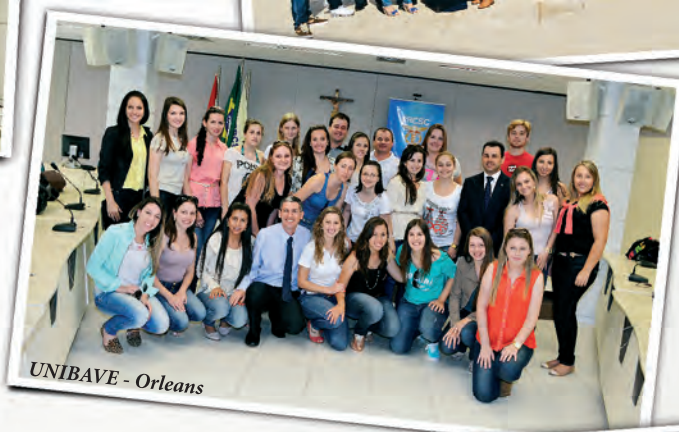
UNIBAVE - Orleans