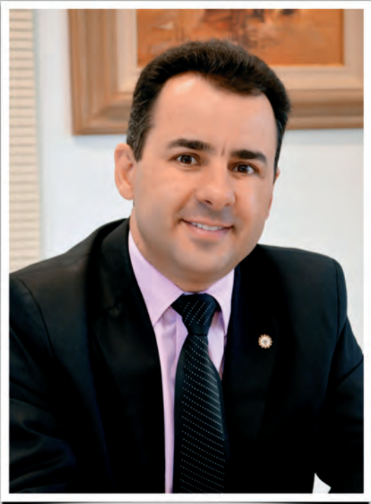
FALE COM O PRESIDENTE (48) 9914-0076 / presidencia@crcsc.org.br

Iniciamos 2013 com muitos desafios e nos preparando para o que virá em 2014. Apesar da preocupação com um ano eleitoral e de Copa do Mundo, o governo federal não dará trégua na implantação das variantes do SPED (Sistema Público de Escrituração Digital), como a Escrituração Contábil Digital do Imposto de Renda de Pessoa Jurídica (EFD-IRPJ) e a EFD Social, a exemplo do que já vem ocorrendo com a EFD Contribuições.