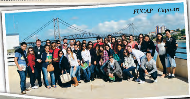
FUCAP - Capivari