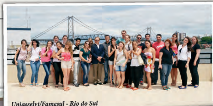
Uniasselvi/Famesul - Rio do Sul