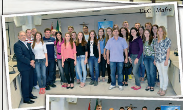
UuC - Mafra