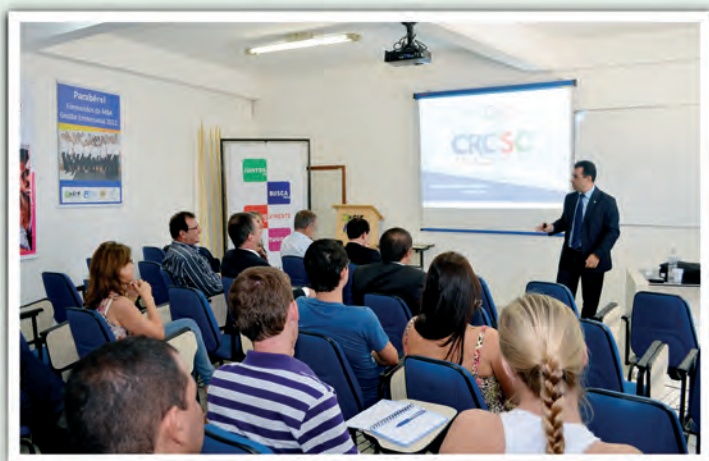
Em Tijucas, a interação com os profissionais.

O programa CRCSC Participativo foi lançado oficialmente no dia 1 de fevereiro, em Florianópolis, e no mesmo dia, à tarde, ocorreu a apresentação em Tijucas, onde profissionais contábeis puderam conhecer detalhadamente as últimas novidades em relação a procedimentos junto ao CRCSC, publicações, fiscalização e ainda as ações em defesa da categoria.