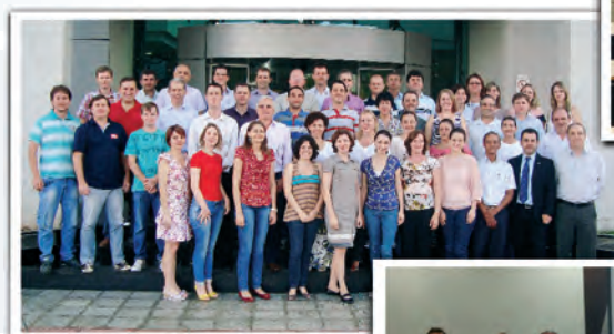
Jaraguá do Sul