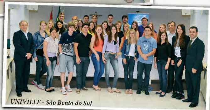
UNIVILLE - São Bento do Sul