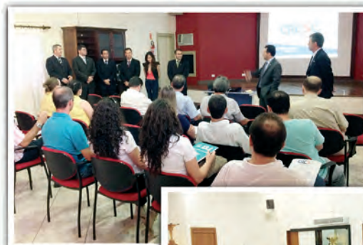
Braço do Norte