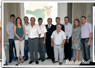
Rio do Sul